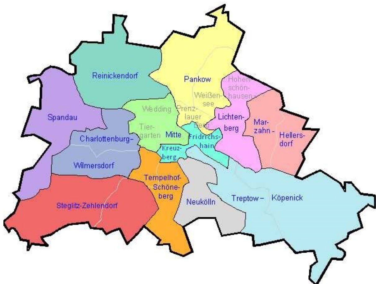
Abbildung1: Berliner Bezirke (von Benedikt Hotze; http://blog.hotze.net/?p=4732 )

Mitte, Friedrichshain-Kreuzberg, Pankow, Charlottenburg-Wilmersdorf, Spandau, Steglitz-Zehlendorf, Tempelhof-Schöneberg, Neukölln, Treptow-Köpenick, Marzahn-Hellersdorf, Lichtenberg, Reinickendorf